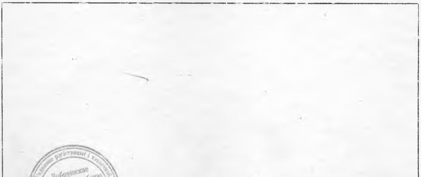
СХЕМА РАСПОЛОЖЕНИЯ ЗДАНИЯ (СООРУЖЕНИЯ)

НАЧАЛЬНИК БЮРО ТЕХНИЧЕСКОЙ ИНВЕНТАРИЗАЦИИ